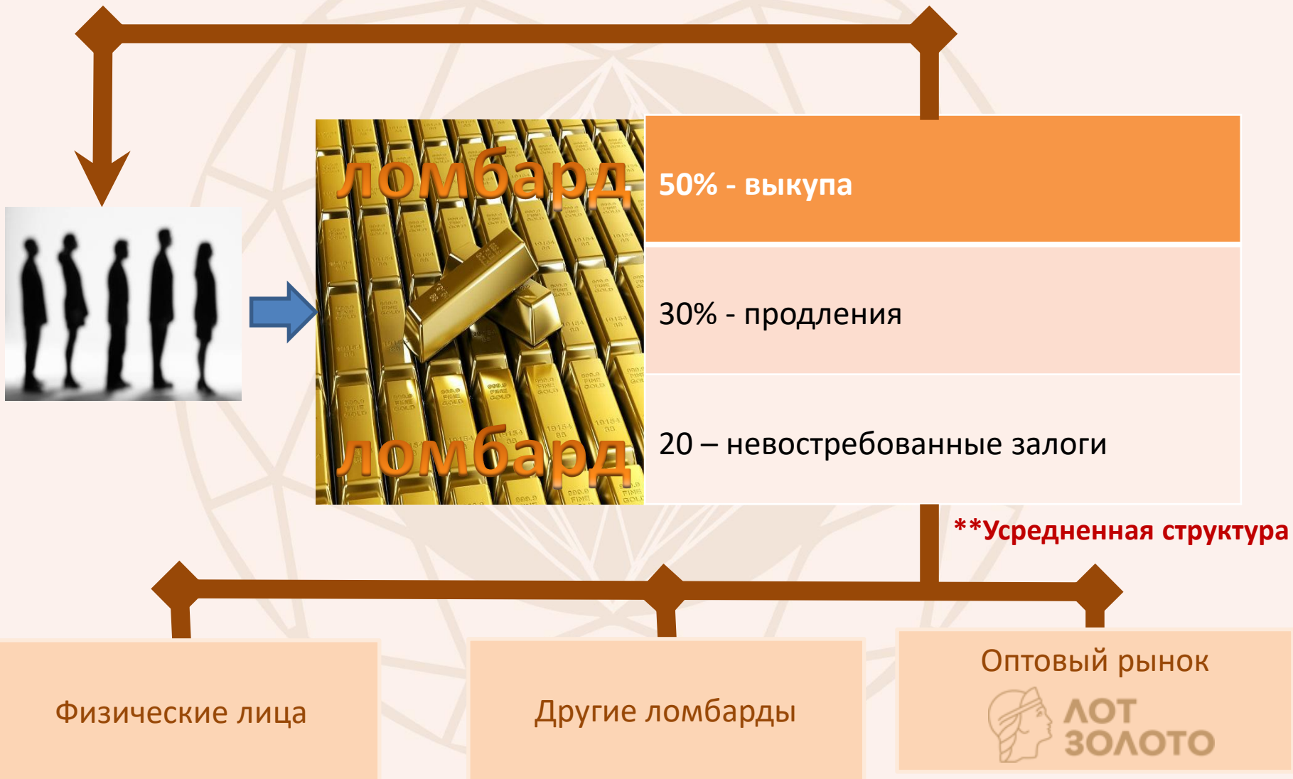
Схема работы ювелирного ломбарда