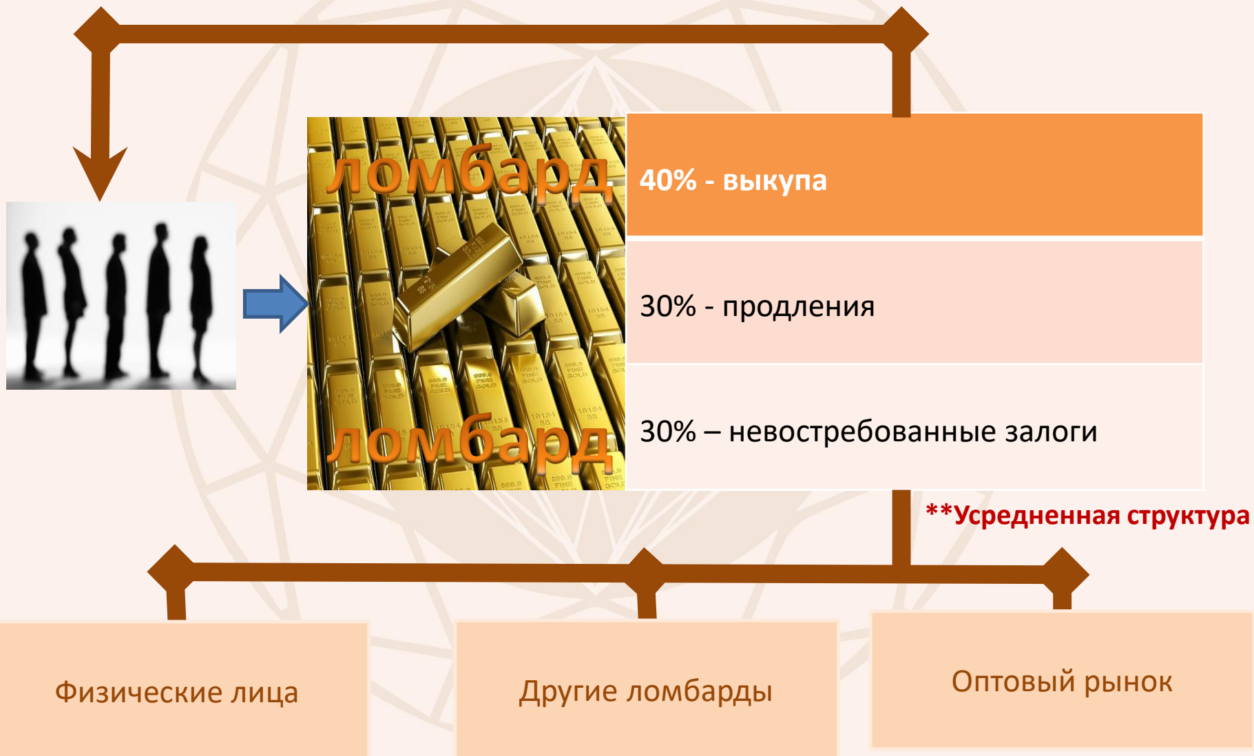
Схема работы ювелирного ломбарда